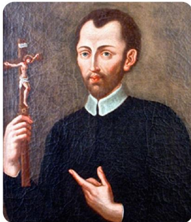
Saint Alphonsus Liguori

Khi suy niệm về Thánh Tâm Chúa Giêsu và tình yêu bao la của Đức Kitô dành cho nhân loại, chúng ta nhìn lại những thiếu sót của mình trước tình yêu ấy và nhận ra nhu cầu phải đền tội. Chúng ta cũng dành giây phút này để sám hối như một quốc gia vì những lỗi lầm trong quá khứ của đất nước mình. Chúng ta hãy cầu xin ơn tha thứ và chữa lành cho những tổn thương do các tội lỗi ban đầu của quốc gia gây nên, đặc biệt là chế độ nô lệ và nạn phân biệt chủng tộc. Một yếu tố cốt lõi của lòng sùng kính Thánh Tâm là đền tạ , nghĩa là sửa lại những điều sai trái mình đã gây ra, xin Đức Kitô tha thứ tội lỗi chúng ta và biến đổi tâm hồn chúng ta để biết yêu thương như Người yêu thương. Chúng ta hãy cùng cầu nguyện với thánh Anphongsô Ligôri, Đấng sáng lập Dòng Chúa Cứu Thế: