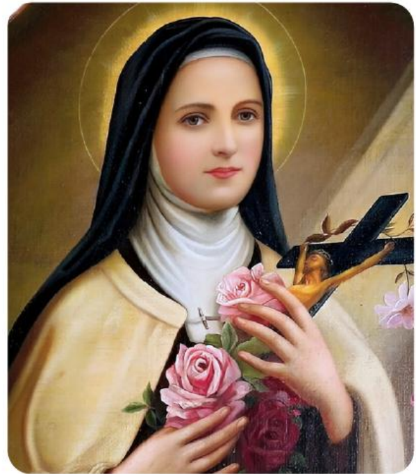
Saint Thérèse of Lisieux

Thánh Têrêsa Hải Đòng Giêsu, “Bông hoa nhỏ”, đã thấu hiểu sâu xa Trái Tim hiền lành và khiêm nhường của Chúa Giêsu. Khi suy niệm về việc để tình yêu Đức Kitô biến đổi mình, thánh nữ viết: “Điều làm Chúa Giêsu đẹp lòng là khi Người thấy tôi yêu mến sự bé nhỏ và nghèo khó của mình, cùng niềm hy vọng mù quáng mà tôi đặt nơi Lòng Thương Xót của Người... Càng yêu đuối, càng không có ước muốn hay nhân đức riêng, thì càng thích hợp hơn để tình yêu thiêu đốt và biến đổi ấy hoạt động.” Chúng ta hãy hiệp cùng thánh Têrêsa cầu xin cho tâm hồn mình được trở nên khiêm nhường như Chúa Giêsu: